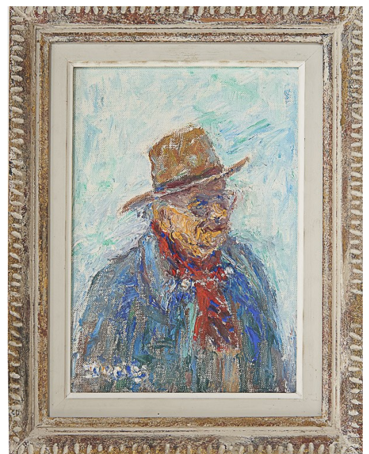
Autoportrait au chapeau, 1980 Huile sur toile – 35,5 x 27,7 cm