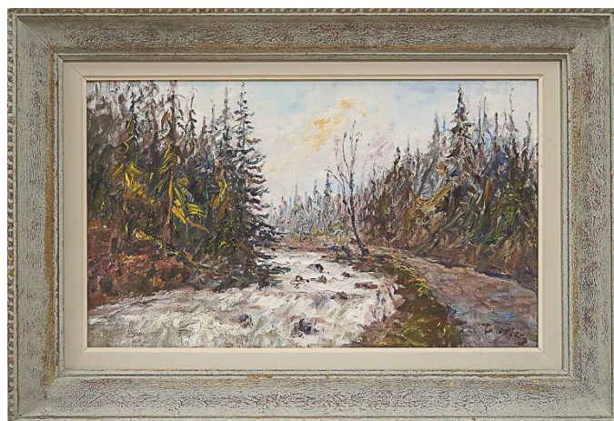
La Lemme, 1977

En conclusion, les spectateurs sensibles à ce mélange entre tradition et nouveauté sauront sans doute apprécier à sa juste valeur l'œuvre de Julien Duriez.