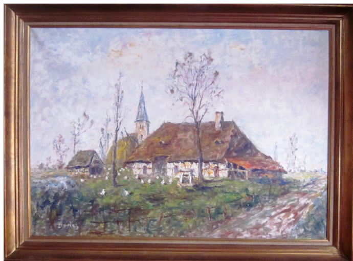
Ferme bressane à Ratte, 1983